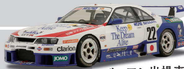
ル・マン出場車 『GT-R LM』