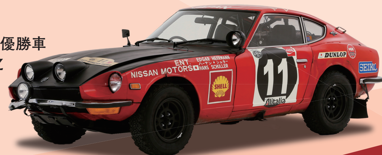
サファリラリー 優勝車 ダットサン240Z

2023 9.30 sat 10:00-16:00 10.1 sun 10:00-15:00