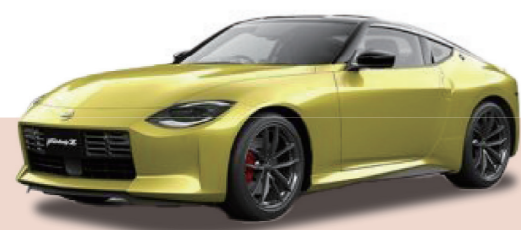
『フェアレディZ』 2023年モデル

世界有数のラインナップ合計20台が集結! フルモデルチェンジ!新型セレナがやってくる!