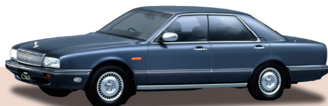
社会現象を巻き起こした『シーマ』