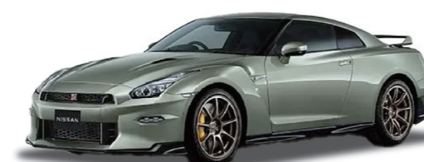
待望の2024年モデル 『NISSAN GT-R Premium edition』