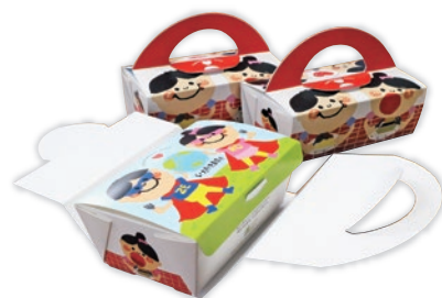
令和2年度環境省実施 「Newドギーバッグアイデアコンテスト」 福島県知事賞受賞作品