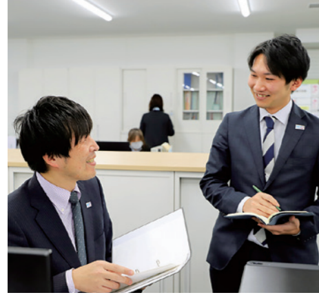
「ものづくりを通して地域に貢献したい」という熱い思いをもって仕事に取り組んでいる