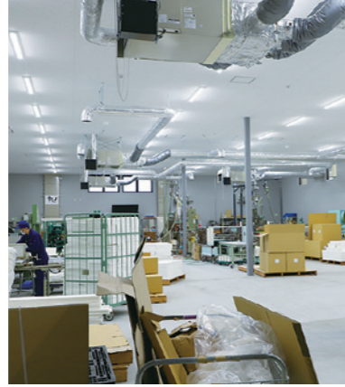
独自の技術を生かした「ワンダーエコシリーズ」など、安心・安全なものづくりを展開する