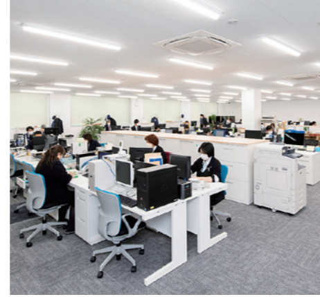
間仕切りのない広々とした事務室では、コミュニケーションの取りやすい環境を整えている