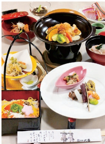
宴会料理(予算/4,000円)の一例。山菜の天ぷらやちらしなど四季折々の味を堪能できる

福島市内に4店舗を構える和食処。行き届いた心遣いで、大切な節目にゆっくり食事と会話を楽しめる。宴会料理は4,000円(飲み放題付きは6,000円)から。予算など要望に合わせて用意するので、気軽に相談を。5名以上の宴会であれば無料送迎の対応可能。その他、ランチにも提供している「鯛茶漬け膳」(2,200円)もおすすめ。