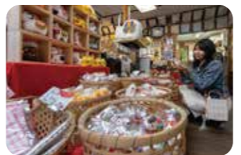
お店では三春駒やお面、干支の他、色によってご利益が変わる豆だるま(8色)も人気