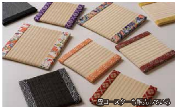
畳コースターも販売している

畳の製造過程を見学しながら文化や歴史を学ぼう。実際に畳づくりも体験でき、い草香る畳カフェでくつろぎの時間を過ごせる。コーヒーは1杯550円から。さらに、アフタヌーンティーも3,300円からと、和カフェとしても利用してほしい。また、オンラインで工場見学もできるので、遠方でもまずは相談を。店内には体験施設、カフェの他に、畳の素材から作った小物などが買えるショップもあり。