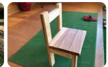
DIY体験で作った木製の椅子は本格派。素朴で木の温もりを感じられるデザインもかわいい！