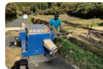
黄金色に輝く稲穂を刈り取る体験に感動。稲刈りを通して収穫の喜びを味わうことができる

「火」と「暮らし」をテーマに、様々な体験や学習ができる『ひとくらす』。レンタルオフィスや会議室を備えた体験型宿泊施設として世代を超えた人と人とのつながりが生まれている。新割り体験や製材機体験はスタッフがしっかりサポートしてくれるので子どもたちでも安心。木製の机や椅子を作るDIYもきっと楽しい思い出に。田植えや収穫など季節ごとに農作業体験もできるのでご予約を。廃校ならではのどこか懐かしい空間と自然の中で、家族や友達と一緒にワイワイ楽しもう。