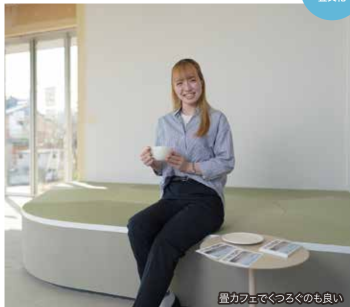
畳カフェでくつろぐのも良い