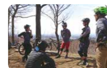
全長約6kmのコースの中に様々なルートがあり、周回もできるトレイル