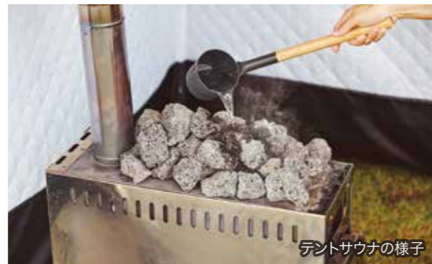
テントサウナの様子

『yodge』の過ごし方は十人十色。グランピングや宿泊なら、合わせてテントサウナはいかが?日常から離れて心と身体を整え、森の匂いと里山を感じる外気浴はここでしか味わえない体験。BBQやピザ作りなど家族で楽しみたい体験が目白押しだ。また、日が暮れたら焚き火もおすすめ。揺らめく炎と薪の弾ける音で非日常体験を満喫できる。体験は予約必須なので、3日前までに問い合わせを。