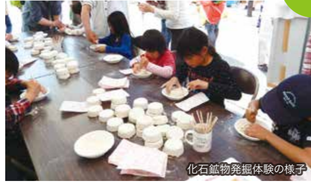
化石鉱物発掘体験の様子