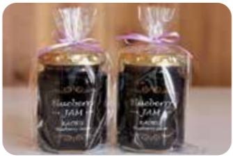
無添加・無着色、保存料ゼロのジャムや果肉の食感がたまらない果汁飲料、雑貨なども販売