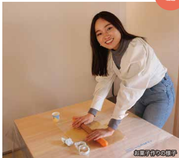
お菓子作りの様子