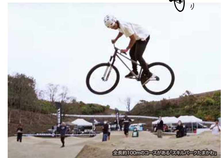
全長約100mのコースがある「スキルパークたまかわ」