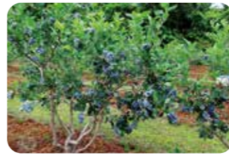
園内では24品種を栽培。甘くて大粒や酸味があるものなど、様々な味わいを楽しめる