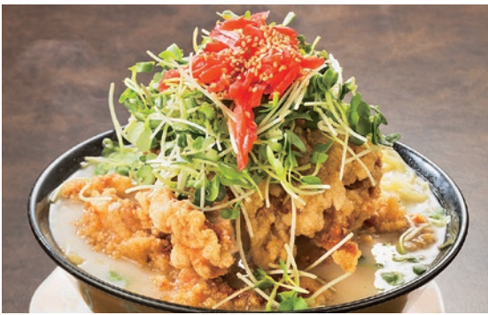
「一番人気の「もっこりとりからーめん」(1,045円)で気分はアゲアゲ！」

アイデアあふれる中華が自慢。広々とした座敷やカウンターなぞ子連れから「お1人様」まで幅広い人が訪れる。写真は甘みのある鶏白湯ラーメンに、特大鶏モモ唐揚げが山のごとく重なる一杯。揚げたて唐揚げはズッシリ、衣はカリッ、中はジューシー。カイワレと紅ショウガが最後まで飽きさせない名脇役に。