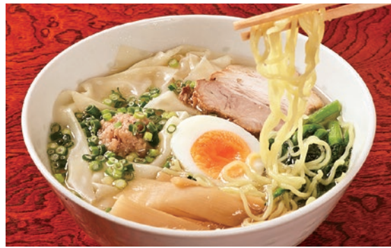
「押し」の「塩ワンタンめん」は1,155円。平日限定でお得なセットもある

「中華さくら」の姉妹店でボリューム満点の町中華。『さくら』では食べられないオリジナルメニュー「塩ワンタンめん」はあっさり塩ベースですっきりとした味わい。ぶりぶり食感でつるつとしたのど越しの自家製ワンタンが自慢だ。他に「ワンタンめん」「ニンニクの芽ラーメン」がオリジナル。