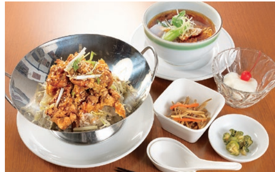
「鳥唐揚げ丼セット」(1,050円)。ボリューム満点の鳥唐揚げ丼とミニラーメンが楽しめる

親しみやすい雰囲気と豊富なメニューで長年愛される町中華。お得なセットメニューの中でも人気なのが「鳥唐揚げ丼セット」(1,050円)。酸味が利いた油淋ソースに絡めた唐揚げ丼は食欲をそそる一品。さらに、ミニラーメン、小鉢、杏仁豆腐が付いて満足感もバッチリ。他のセットも要チェック。