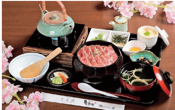
「福島牛ひつまぶし膳」(3,380円)。和風ダシは常にアツアツで着が進む

信夫山の麓で桜と一緒に優雅な食事はいかが? 写真の「福島牛ひつまぶし膳」はSNSで話題。さっぱりとした甘みと風味豊かでまろやかな味わいが魅力の最高ランク福島牛を使用している。まずはそのままだく。その後、薬味、ダシ、卵黄など様々な食べ方で極上の食体験を楽しめる。ランチ・ディナーともに10食限定。予約の場合は電話か公式LINEから問い合わせを。食事の方は持ち帰りの3種類のビーフカレー(800円~)が半額で購入できる。