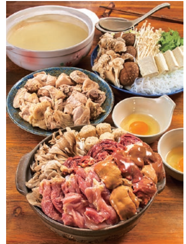
どちらも味わいたい、選べる鍋。秘伝の「鳥鍋」はすぎ焼き風。鶏の旨みが詰まった「水炊き」はあっさり

昭和25年開業の伊達鶏料理専門店。大正時代の古民家を改装した店内には、広い座敷や密やかな小部屋があり、落ち着いた過ごせる。宴会なら鶏尽くしの3,500円コース(酒別・4名~)を。「鳥鍋」または「水炊き」の鍋に、焼鳥やたつた揚げなど、伊達鶏を思う存分楽しめる。焼き鳥セット(5種5本・1,200円)などでのんびり飲むのも魅力。