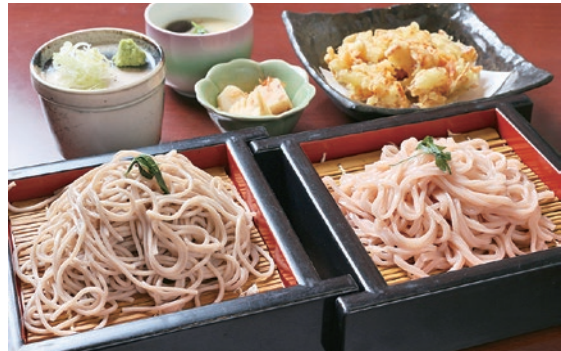
桜そばと桜うどんが両方楽しめる「桜セット(ハーフ)950円」。桜エビのかき揚げ付き

本格的な二八そばが気軽に味わえる『佐吉』。今年も春限定の桜そばと桜うどんが登場！ほんのりとしたピンク色が可愛い麺には桜の葉を練り込み、鼻に抜ける香りが春を感じさせる。1玉60円で通常メニューも桜そばor桜うどんに変更可能。食べ比べもおすすめ。この時期だけの季節のそばを味わってみて。