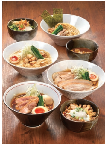
バラエティ豊かなラーメンと丼ものを用意。ワンタンや煮卵などトッピングもお好みどうぞ

朝7時から営業しており、「朝ラー」から昼時まで楽しめる。東京の有名店「らぁ麺やまぐち」監修の麺「麦の香」は小麦の風味となめらかな食感が特徴で、幅広い世代から支持を集める。定番の「あご出汁醤油らぁめん」や「貝出汁塩らぁめん」(各800円)のほか、昨年登場した「徳島らぁめん」もファン多数。お気に入り1杯を見つけて。