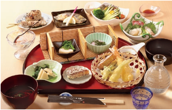
春の味覚が楽しめる「桜コース」(2時間飲み放題付き・5,500円)はこの時期限定!

気配り上手な女将による隠れ家的酒場。個室席で少人数から貸し切りまでゆっくりくつろげる。歓迎会には春らしい「桜コース」を。サワラの焼き物や道明寺蒸し、メヒカリと春野菜の天ぷらなど丁寧な10品が味わえる。飲み放題付きコースは5,000円からで、予算や料理の希望があればカスタマイズも可能。