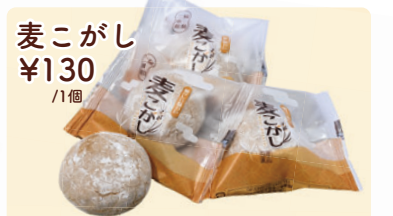
麦こがし ¥130 /1個