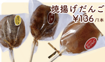
焼揚げだんご ¥136 /1本