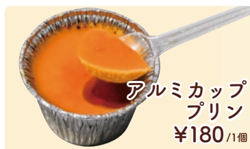
アルミカップ プリン ¥180 /1個