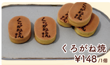
くらがね焼 ¥148 /1個