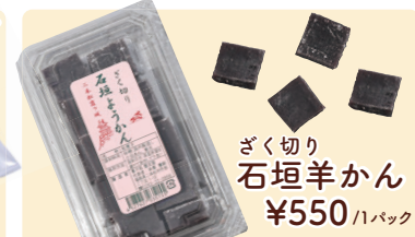
ざく切り 石垣羊かん ¥550 /1パック