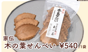
家伝 木の葉せんべい ¥540 /1袋