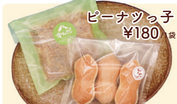
ピーナッツ子 ¥180 /袋