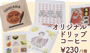
オリジナル ドリップ コーヒー ¥230 /1個