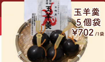
玉羊羹 5個袋 ¥702 /1袋