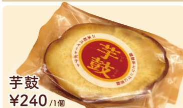
芋鼓 ¥240 /1個