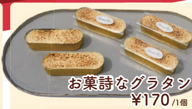
お菓詩なグラタン ¥170 /1個