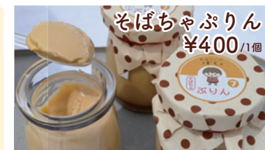
そばちゃぶりん ¥400 /1個