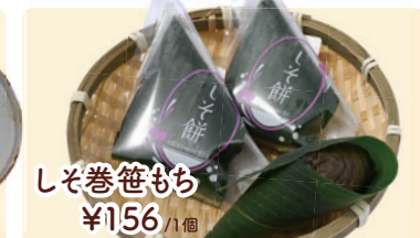
しそ巻笹もち ¥156 /1個