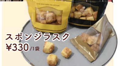
スポンジラスク ¥330 /1袋