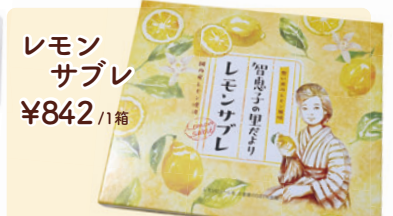
レモン サブレ ¥842 /1箱