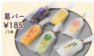
葛バー ¥185 /1本