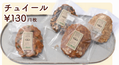
チューール ¥130 /1枚