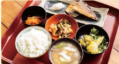
都路の家庭の味が人気で、東京や大阪などから来客があります。