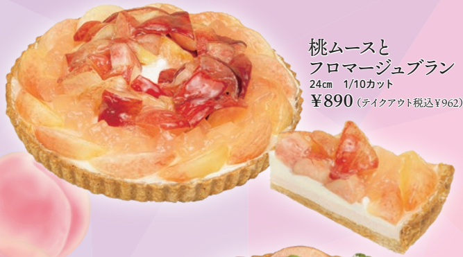
桃ムースと フロマージュブラン 24cm 1/10カット ¥890 (テイクアウト税込¥962)