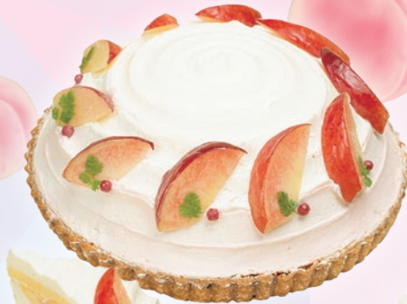
桃のズコット 24cm 1/10カット ¥1,300 (テイクアウト税込¥1,404)