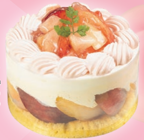
桃のフレッシュ 13cm ¥2,900 (テイクアウト税込¥3,132)