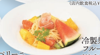
冷製果物屋さんの フルーツカッペリーニ ¥1,260 (店内飲食税込¥1,386)