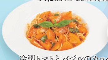
冷製トマトとバジルのカッペリーニ ¥1,380 (店内飲食税込¥1,518)