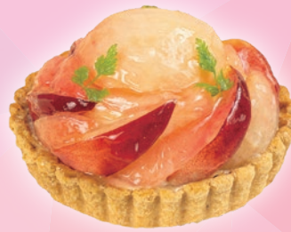
まるごと桃 13cm ¥3,500 (テイクアウト税込¥3,780)