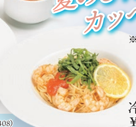
冷製エビと明太子 ¥1,380 (店内飲食税込¥1,518)