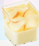
ももジュエル ¥330 (テイクアウト税込¥357)