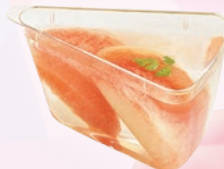
桃とピンクグレープ フルーツのパニエ ¥570 (テイクアウト税込¥616)