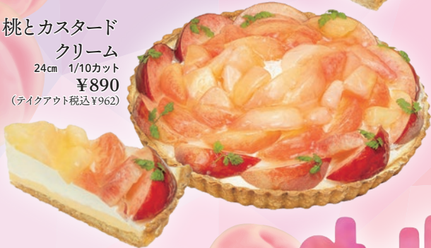
桃とカスタード クリーム 24cm 1/10カット ¥890 (テイクアウト税込¥962)