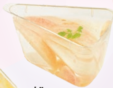
桃のパニエ ¥590 (テイクアウト税込¥638)