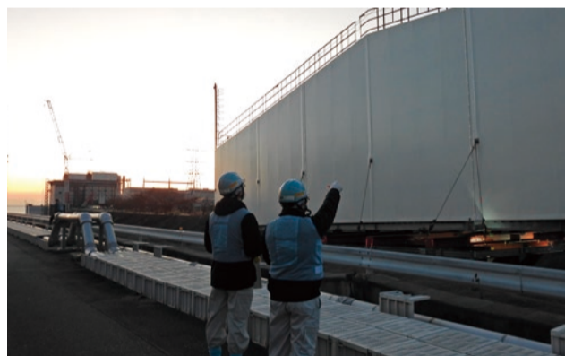
県職員による1号機大型カバー設置状況確認 (早朝)