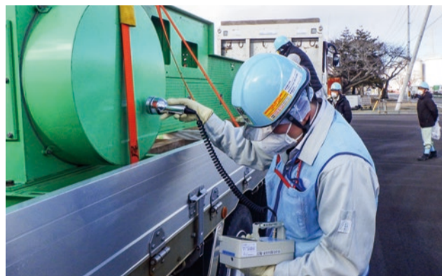
県職員による4号機から搬出する燃料取扱機の表面汚染検査